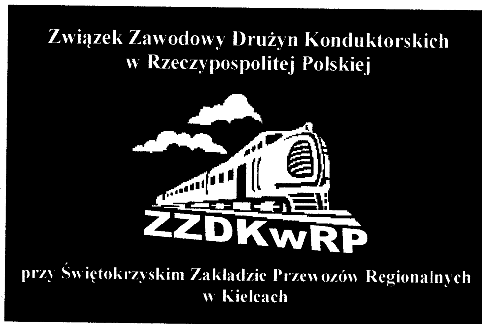
Wzór Nr 2. Flaga ZZDKwRP - wzór miejscowy.