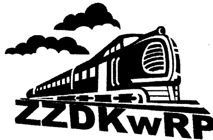
Wzór Nr 2. Logo kolorowe