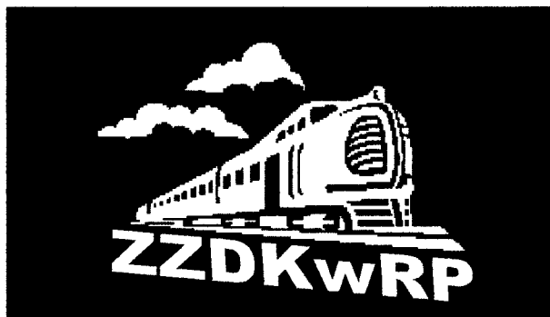
Wzór Nr 3. Logo kolorowe