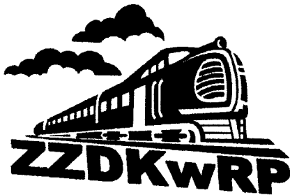
Wzór Nr 1. Logo czarno-białe