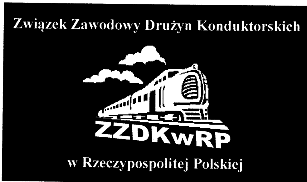
Wzór Nr 1. Flaga ZZDKwRP - wzór ogólny